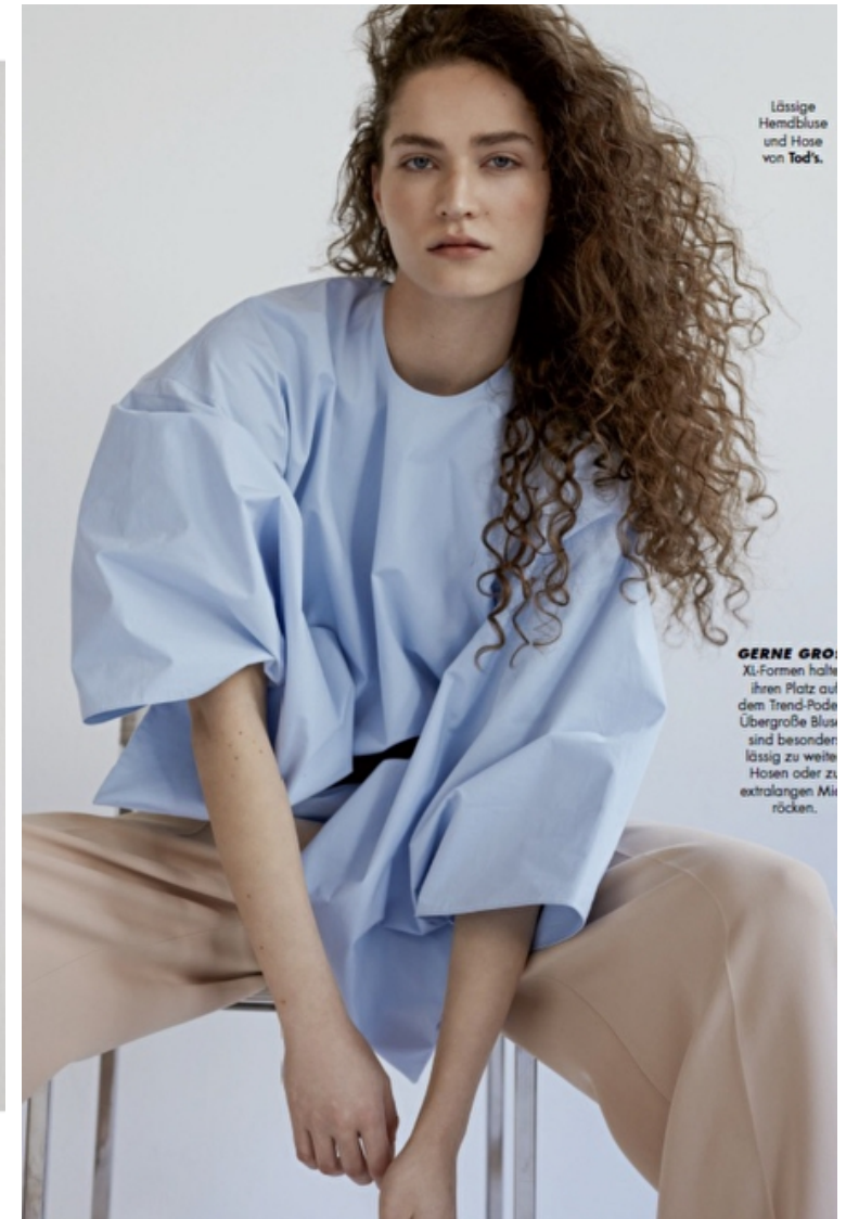
Lässige Hemdbluse und Hose von Tod's.

BEWUSST BETONT Das kleine Schwarze sucht Nähe – und ist auf die Figur geschnitten. Große Ohrringe in Gold oder Silber bringen Schwung in die minimalistische Silhouette.