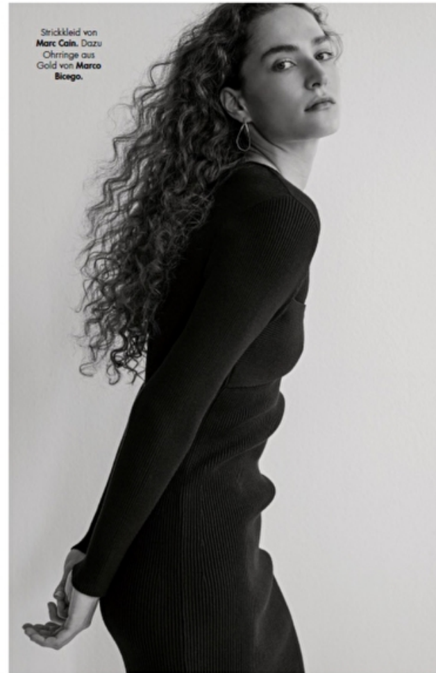
Strickkleid von Marc Cain. Dazu Ohrringe aus Gold von Marco Bicego.

BEWUSST BETONT Das kleine Schwarze sucht Nähe – und ist auf die Figur geschnitten. Große Ohrringe in Gold oder Silber bringen Schwung in die minimalistische Silhouette.