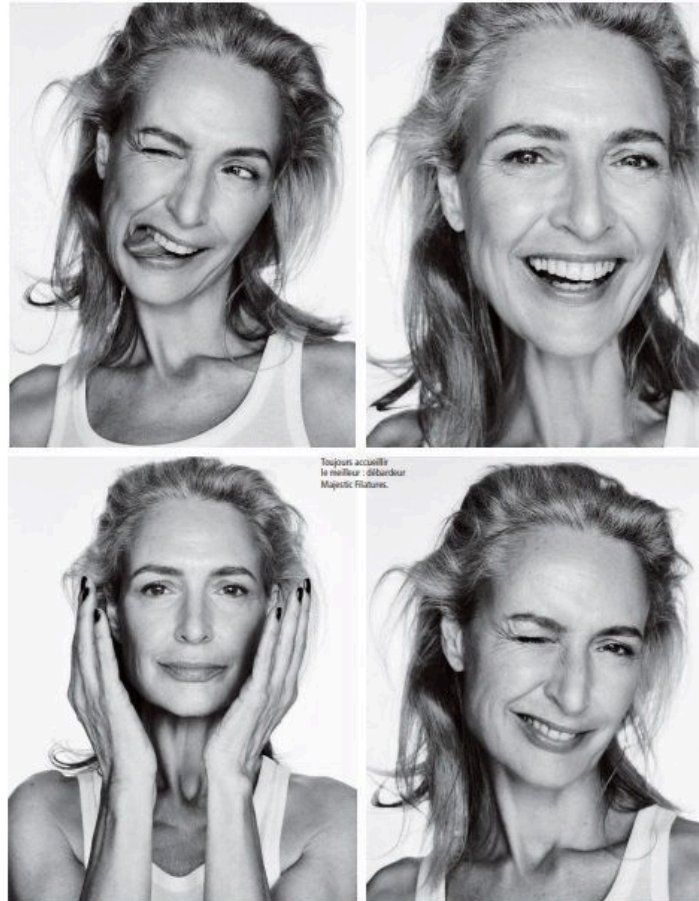
Toujours accueillie le meilleur : distributeur Majeestic France.